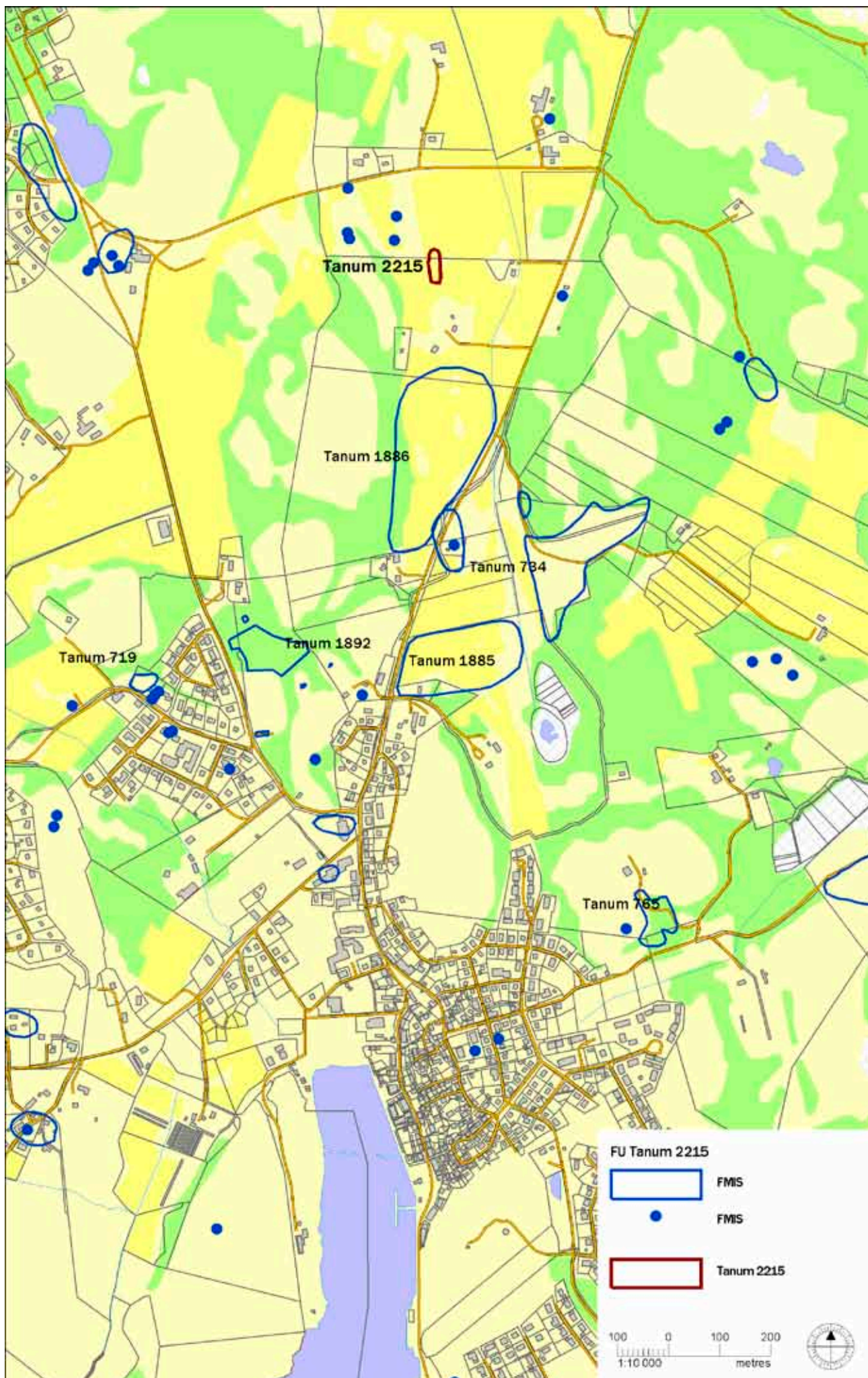
Illustration 1. Översiktskarta. Fornlämningar omnämnda i texten har markerats med namn på kartan.