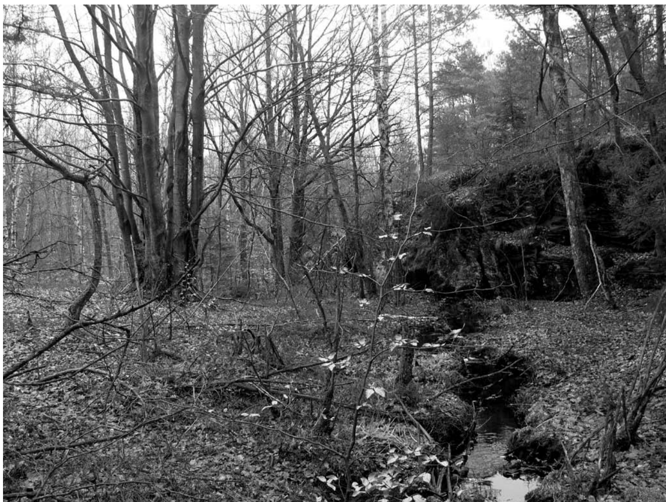
Illustration 3: Liten bäck, naturhänsyn 25.

Vägen går längs med en bäck en liten bit, naturhänsyn 25 . Där vägen passerar över bäcken bör en halvtrumma användas.