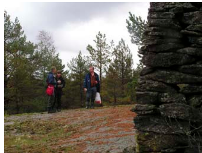
Samtal – arkeolog, biolog och beställare.

Jämställdhet handlar både om rättvisa och om kvalitet på verksamhet och forskning. Jämställd-