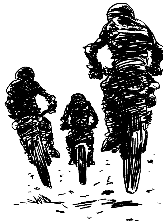
En illustration ur Sista resan, en av Rio Kulturkooperativs skönlitterära utgivningar. Tecknare är Mats Källblad.

Förlaget är viktigt för att vi skall kunna fullfölja vårt förmedlaransvar. Vi får genom våra uppdrag kunskap som det är viktigt att göra tillgänglig för allmänheten. Detta försöker vi uppnå genom att publicera våra rapporter och utredningar på vår hemsida. Förlaget finns presenterat på Rio Kulturkooperativs hemsida, och här kan både fack- och skönlitteratur beställas eller laddas ner.