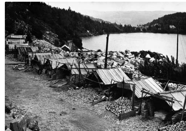
Centrum eller periferi? Stenindustri i Krokstrand, Strömstads kommun.

Det tycks finnas några generella regler som gäller för all typ av etablering, att de villkor som styr har två nivåer. Den första är att man alltid grundar den första enheten på den mest lämpade ytan, Berglund 1996 . Detta påverkar i sin tur fortsatta möjliga etableringar, då den första enheten kan upprätthålla ett historiskt inflytande eller kontroll över större ytor än vad som brukas. Den andra huvudregeln innebär att den nygrundade enheten inte ses som en autonom enhet. Den skulle då ha haft en komplett resursnärmiljö, vilket i princip är omöjligt om man har flera samtida bosättningar inom samma landskapsavsnitt, Dear & Wolch 1989, Nyqvist 2001 . Det sista innebär att vi kan påträffa flera enheter inom samma landskapsavsnitt, och att vi kan räkna med att det finns samband mellan de enskilda etableringarna, då de inte behöver vara självförsörjande. De var en del av en strategi och så länge strategin fungerade och behovet fanns, förekom dessa enheter som samtida aktiva element i bebyggelsen. Etableringen kan generellt delas in i permanent och temporärt nyttjande. Den temporära kan i sin tur vara återkommande, och nyttja fasta strukturer som hus eller hägnader. Givetvis kan den återkomma utan nyttjande av fasta strukturer, men detta borde innebära antingen kortare säsongsaktiviteter eller längre mellanrum mellan användandet av resursytan.