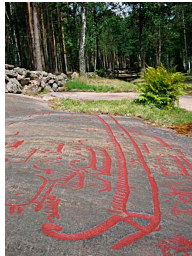
Nytolgade hållristningar i Torsbo.

De bohuslänska hållristningarna gjordes under en lång tidsrymd (närmare 1500 år, mellan cirka