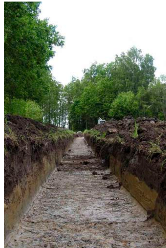
Schaktningsövervakning åt Göteborgs Energi.