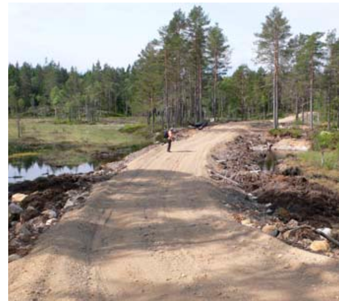
Med ett konventionellt synsätt där man räknar kronor och ören är det svårt att värdera till exempel biologisk mångfald. På bilden en nyanlagd skogsbilväg i myrmark, Årjängs kommun.

Genom att tillgodose kultur- och naturvärden i samhällsplaneringen kan man integrera dem på ett naturligt sätt vid förändringar av vår närmiljö. De olika värdena kan då förhöja upplevelsen vid nya anläggningar och återkoppla till platsens historia genom att de tydliggör exempelvis kontinuitet i brukandet av området. Ett möte med våra stora monumentala fornlämningar – som hållristningar, rösen eller runstenar – väcker ofta intresse, men lika tankeväckande kan också en mer oansenlig länk till vår historia – som ett boplatssläge eller ett ortsnamn – vara.