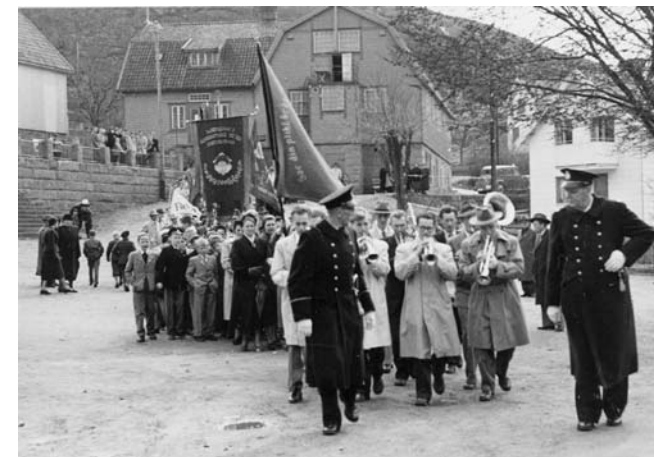
Social organisering. 1:a maj-demonstration i Hunnebostrand 1950.

Studiet av sociala processer bygger främst på rumsliga analyser av fyndmaterial och fysiska lämningar, så som hus, hyddor, härदार, smedjor etc. Rumsliga strukturer byggs ofta upp under långa tidsperioder, vilket är en fördel vid studiet av sociala processer. Ett samhälles sociala organisation återspeglas i dess arkitektur, i hur man organiserat den materiella världen och andevärlden genom aktivitetsytor, inredning och strukturering av bostaden. Med bostaden avses hela boplatsom-