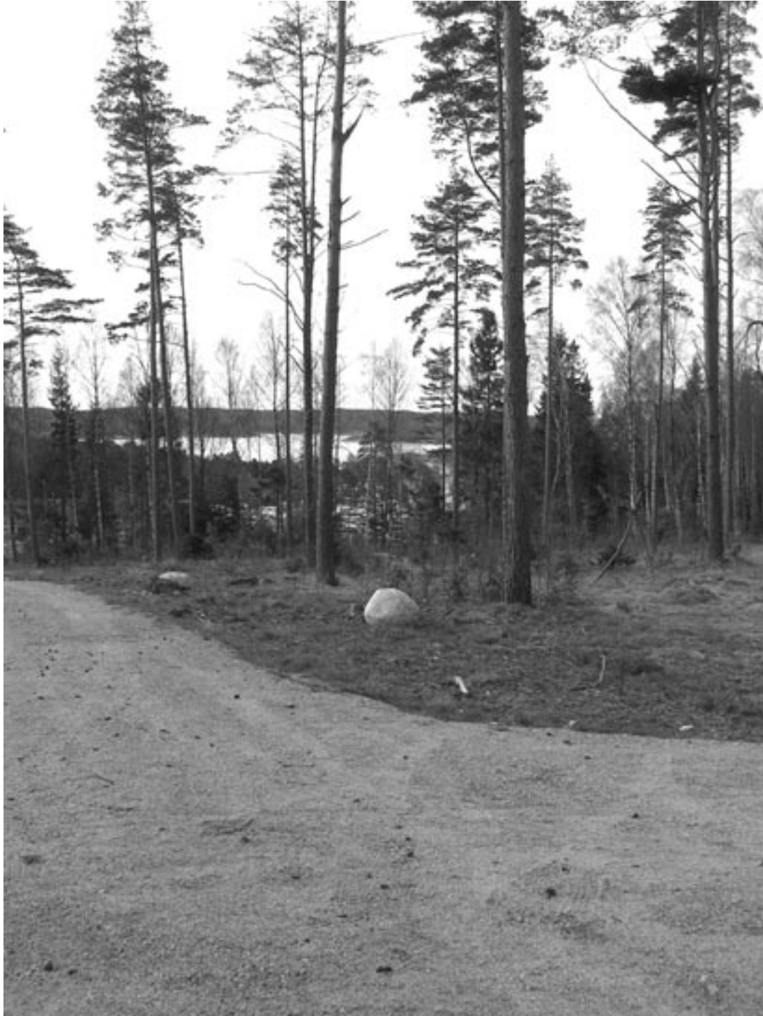
Ill. 1. Utsikt från undersökningsområdet ned mot Dynekilen. Den vid undersökningen upptäckta boplatsen är belägen en bit ned i slänten centralt och till höger i bilden. Fotot är taget mot söder.