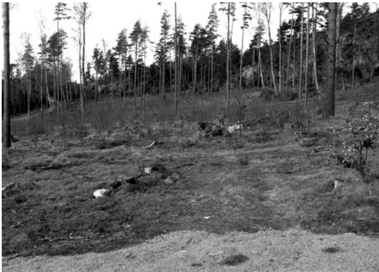
Ill. 2. Västra delen av undersökningsområdet, foto mot väster.

Utredningsområdet är beläget på yttre delen av Hogdalsnäset, sydväst om Hogdal. Planområdet utgörs av kraftigt sydsluttande skogsmark med en nivåskillnad på cirka 25 meter. Det avgränsas i norr av "Rösingfjäll" och i söder av en landsväg. Området har två naturliga