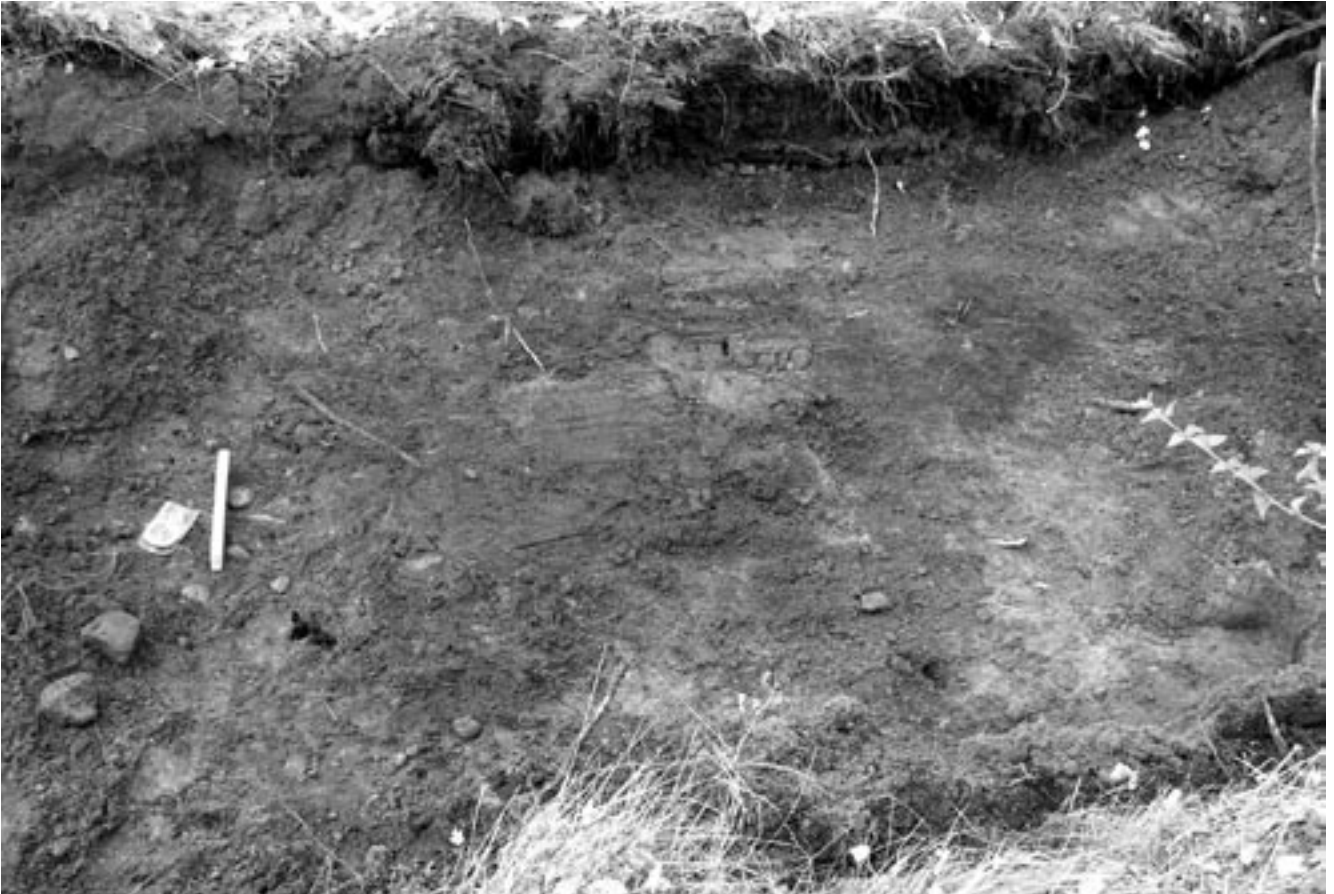
Ill. 4. Anläggning 1 i schakt 21. Foto mot nordväst.

terrasser, troligen från äldre strandlinjer. Den nedre terrassen ligger cirka 25 meter över havet i områdets sydvästra del. Den övre terrassen ligger på cirka 35 meter över havet i områdets nordöstra del. Båda har en utsträckning om cirka 5000 m 2 .